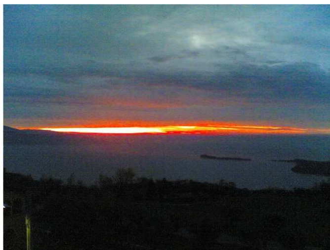
Immagine simbolica del rogo umano del 13 febbraio 1278 nell'arena di Verona